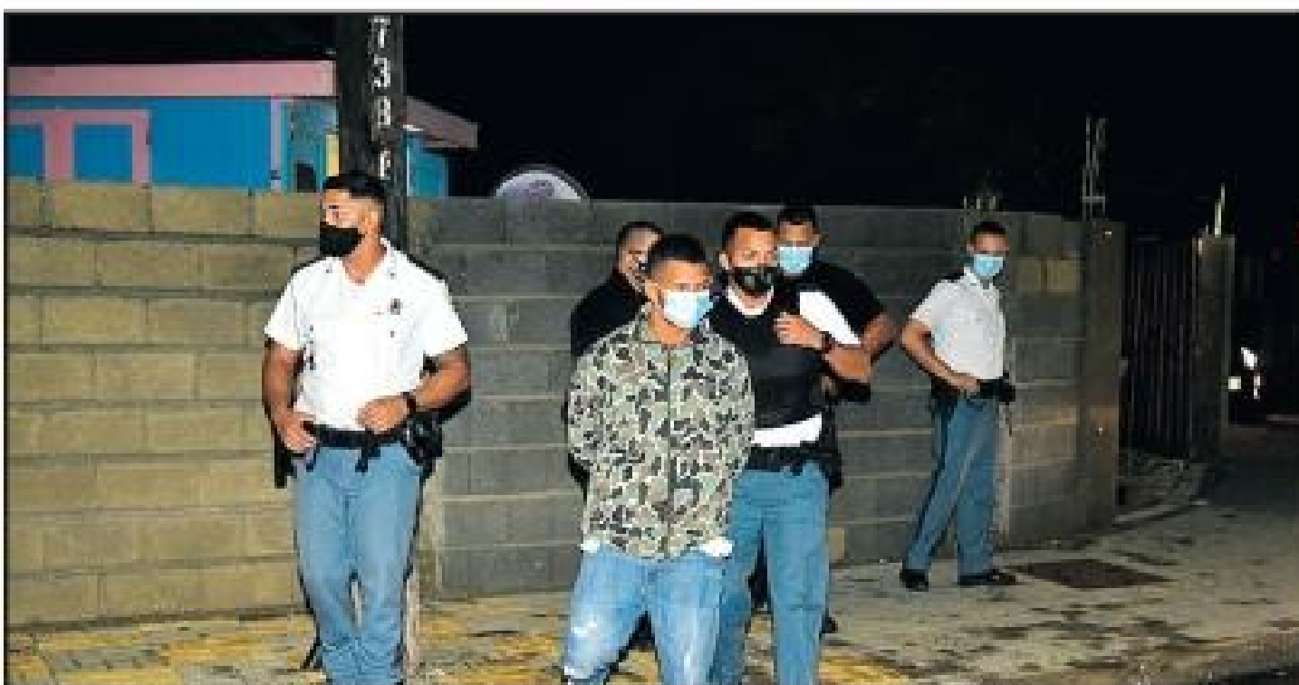
Semeleerstraat - Dialuna di e atraco arina algun minuut despues He's Supermarket na

Monserat, polisnan a bay den e casnan di pueblo di Noord. Esaki tawata door cu e atracadornan lo a bay e direccion ey.